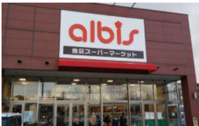
アルビス泉ヶ丘中央店 400m