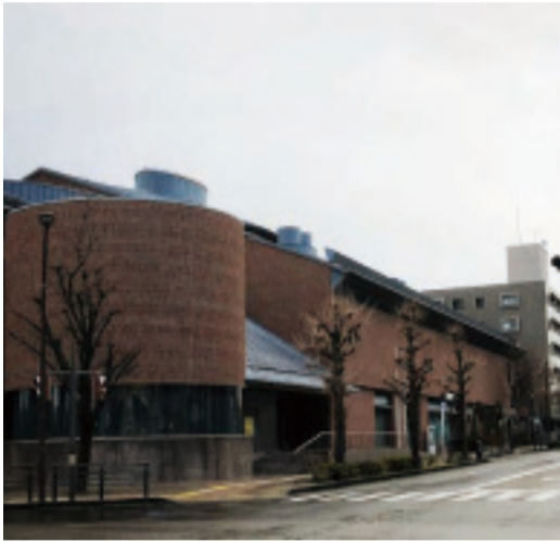
金沢市市立泉野図書館 400m